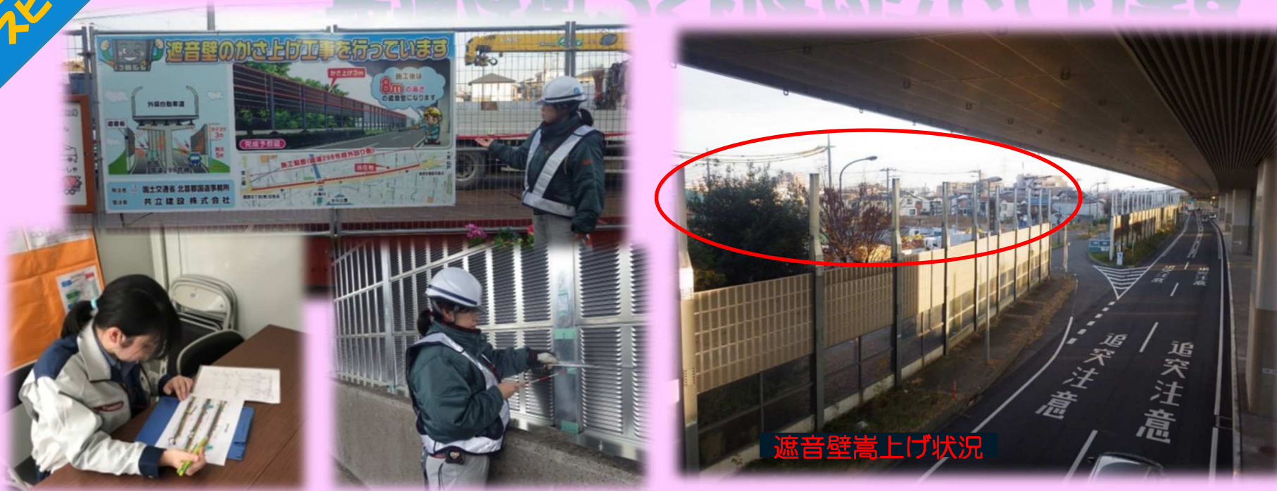
遮音壁嵩上げ状況