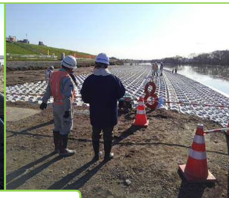
パトロールの様子