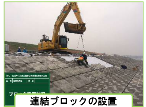
連結ブロックの設置