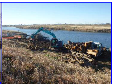
河川敷の樹木伐採の状況