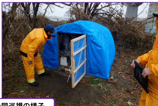
ホームレス合同巡視の様子