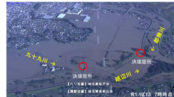
入間川流域における浸水被害状況