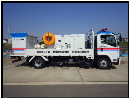
排水ポンプ車 (30m 3 /min)