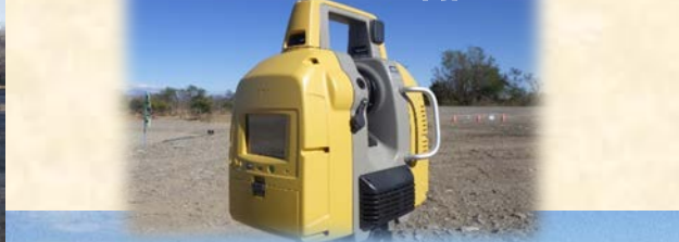
レーザースキャナー本体