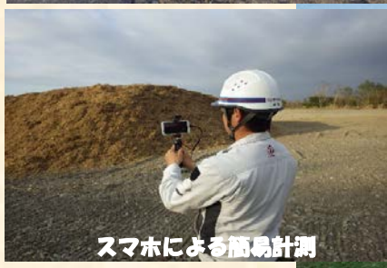
スマホによる簡易計測