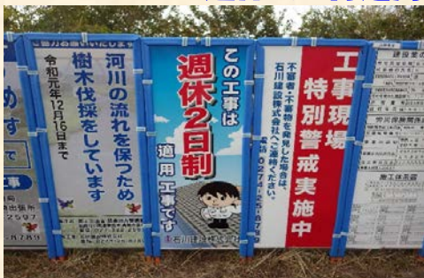
週休2日制適用工事看板の設置