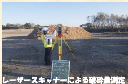
レーザースキャナーによる破砕量測定