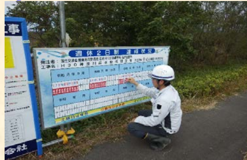
達成状況看板の設置