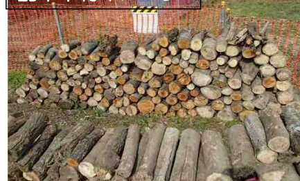
配布木材イメージ