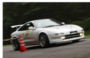
レース後はリフレッシュできました