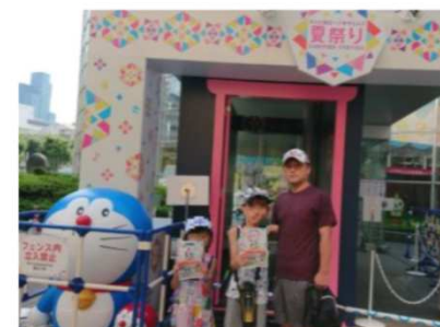
子供たちと遊びに行く機会が増えました