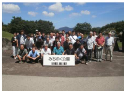
（金）・（土）で社員研修旅行を行いました