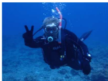
ダイビングでリフレッシュ！