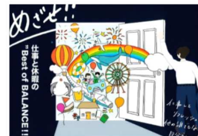
職員のご家族の作品