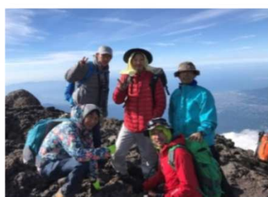
協力業者と富士登山