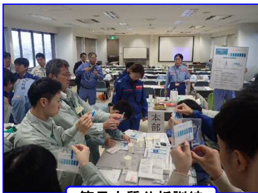
簡易水質分析訓練