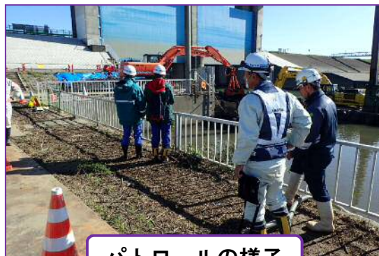
パトロールの様子

11月に入り、どの工事でも本格的に動き出し始めましたので、事故の無いよう監督していききたいと思います。