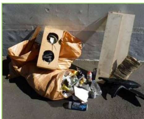
産業廃棄ゴミの不法投棄

5年以下の懲役又は1千万円以下の罰金(法人等の場合は3億円以下の罰金)に処せられる場合があります。