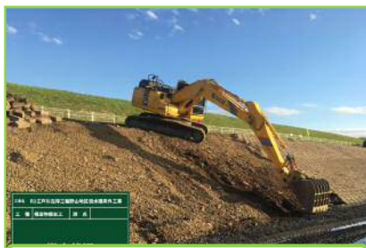
既設護岸ブロックの撤去

現在の進捗状況は、既設護岸ブロックの撤去を行い、鋼矢板の設置を施工し始めたところです。今後、袋詰玉石の設置、法面整形、連結ブロック設置という流れで行っていく予定です。