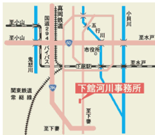
下館河川事務所案内図