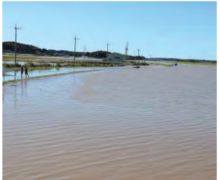
4. 大貫橋付近（涸沼川）