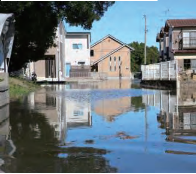
1. 五反田地区住宅街（涸沼川）