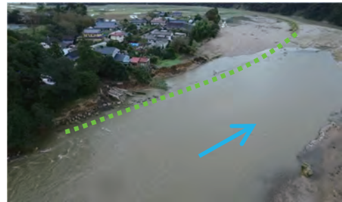
荒川（塩谷） 那須烏山市藤田地先

※下線部は洪水浸水想定区域図作成対象の河川であり、全て公表済（ハザードマップも作成済）