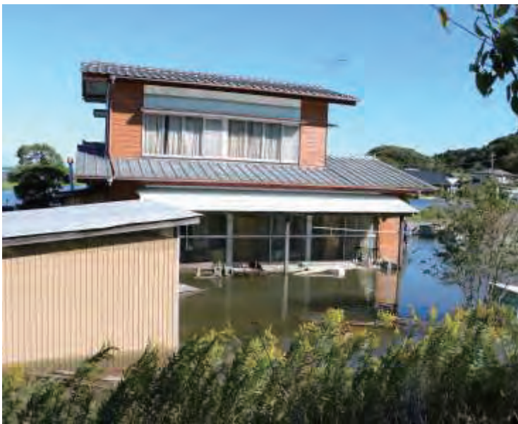
3. 松川地区住宅街（涸沼）