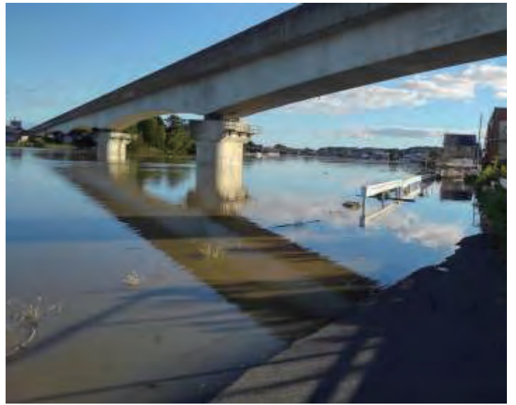
2. 涸沼橋付近（涸沼川）