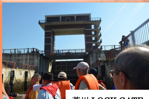
荒川 LOCK GATE