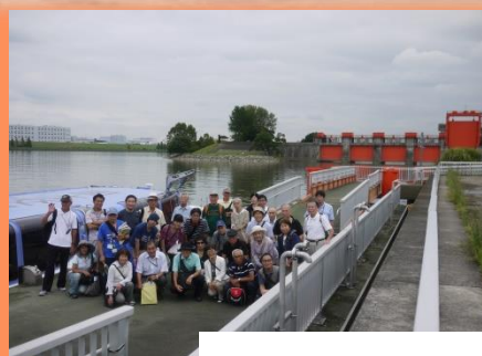
あらかわ号に乗船