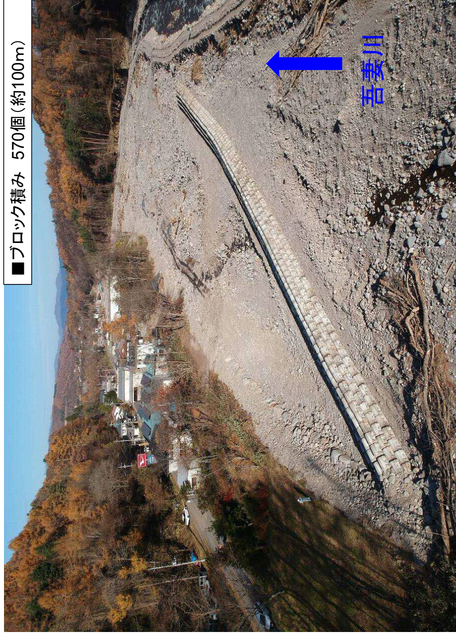
■ブロック積み 570個 (約100m)