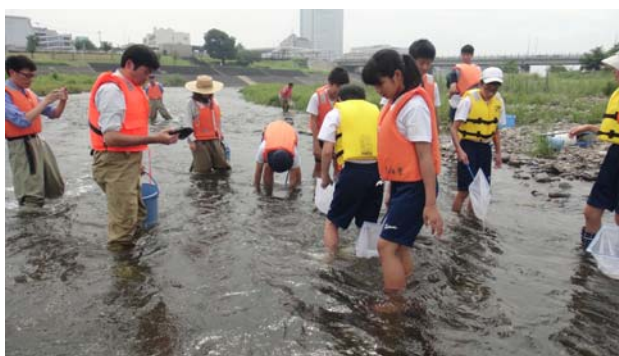
高松(高崎市立片岡中学校)