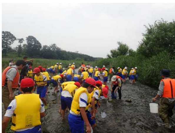
本郷(藤岡市立美九里東小学校)