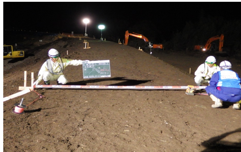
河川の復旧作業状況(埼玉県東松山市)