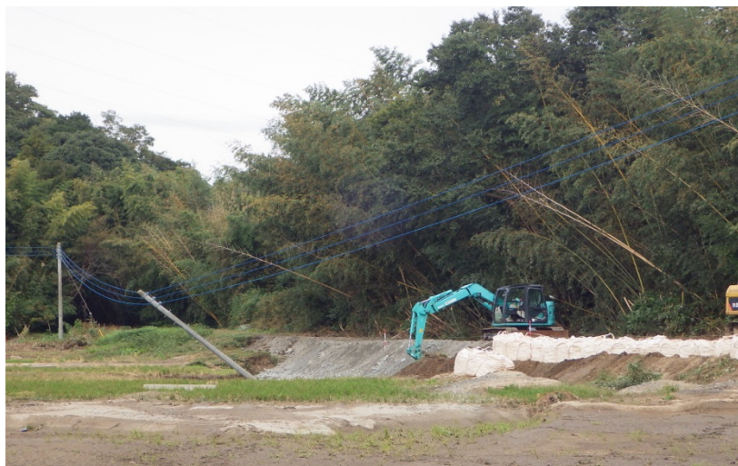
里川の被災状況調査(茨城県常陸太田市常福地町地先)