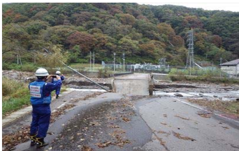
被災状況調査(群馬県吾妻郡嬬恋村)