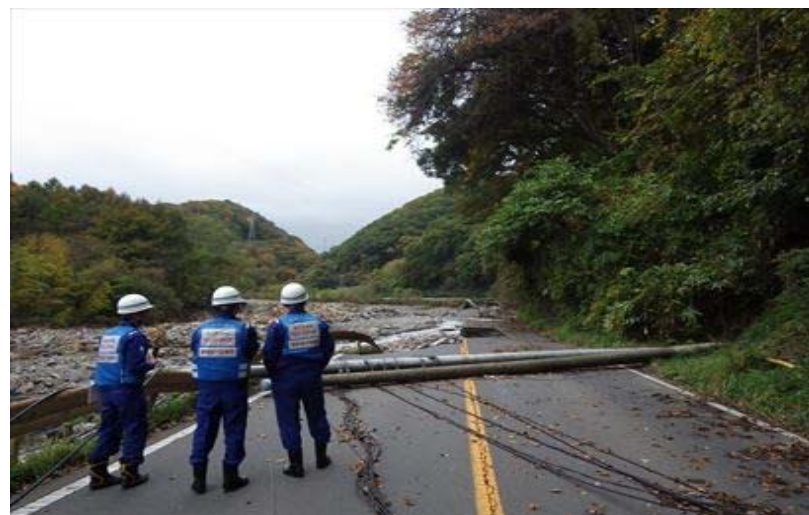
被災状況調査(群馬県吾妻郡嬬恋村)