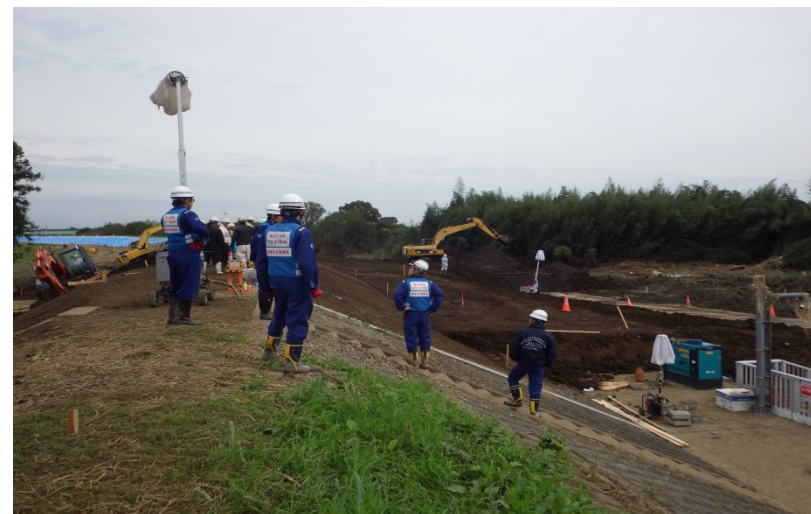
河川の復旧作業状況(埼玉県東松山市)