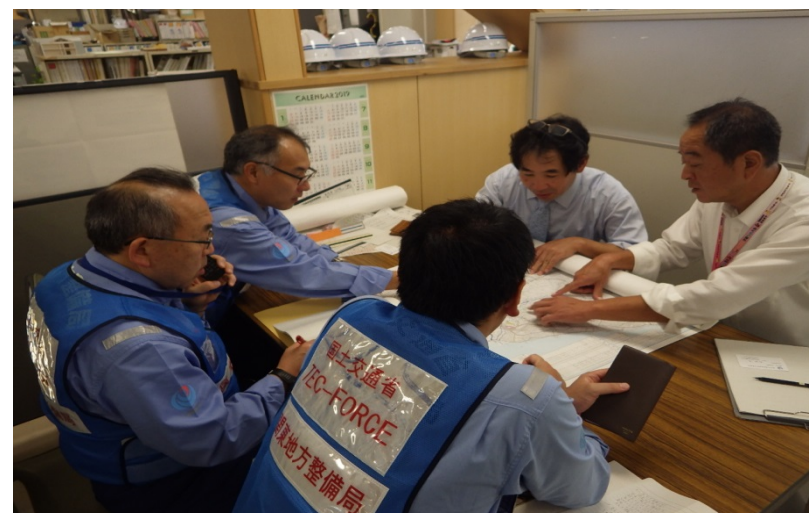
常陸太田市建政部と打合せ(常陸太田市役所)