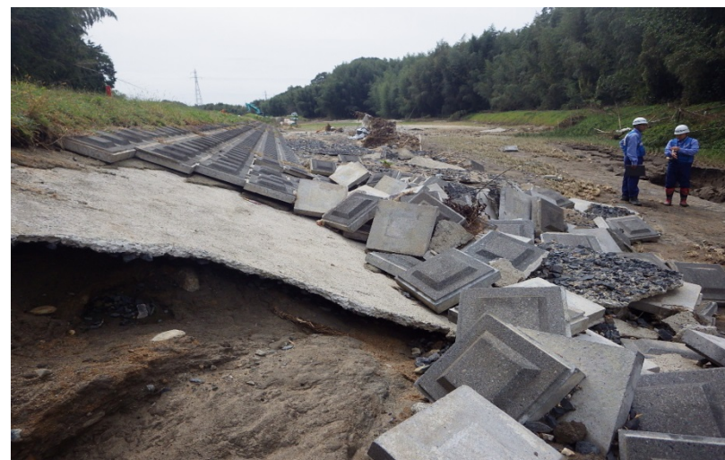
里川の被災状況調査(茨城県常陸太田市茅根町地先)