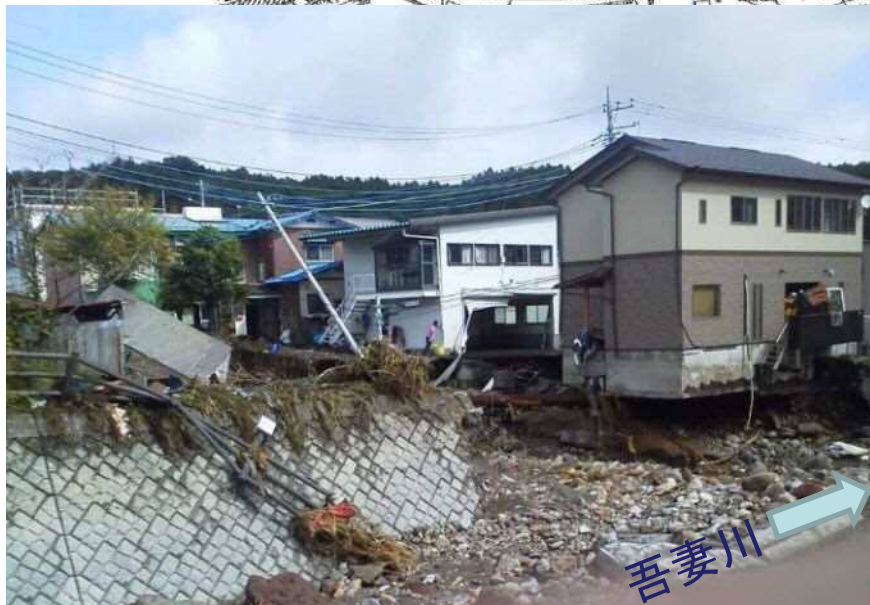
支川合流部の被災状況(R1.10.13)