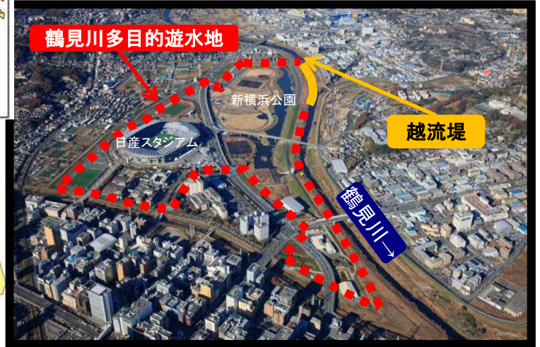
鶴見川多目的遊水地は、平常時には公園等として利用