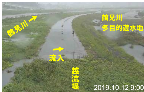
鶴見川の水位が上昇し、越流堤から鶴見川多目的遊水地に流入