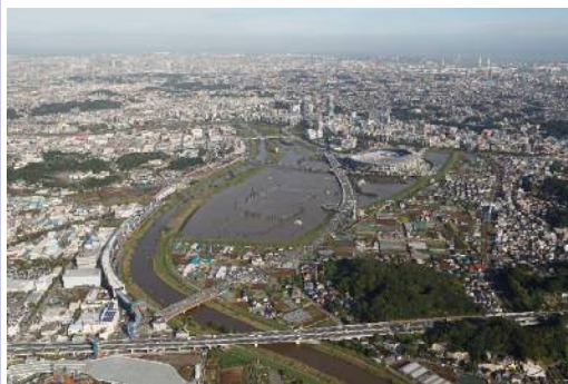
平成26年10月 台風18号の貯留状況