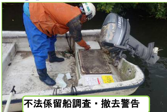
不法係留船調査・撤去警告

これらが河川内にあると、洪水時に流されて河川管理施設や橋梁等に被害を及ぼしたり、油漏れ等の水質事故を発生させる恐れがあります。今後も不法係留船が無くなるよう対応していきます。