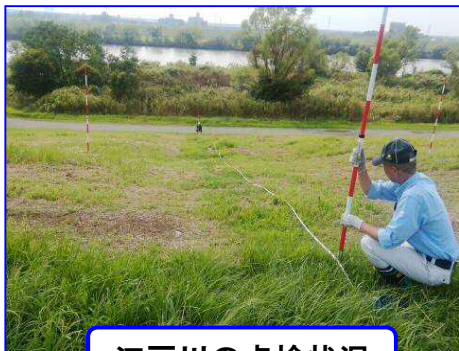
江戸川の点検状況