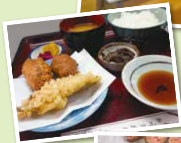
なまず料理 ※メニューの一例