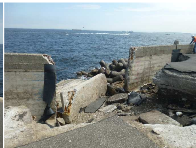
福浦 被災護岸調査状況