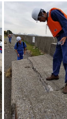
本牧D突堤 被災パラペット調査状況