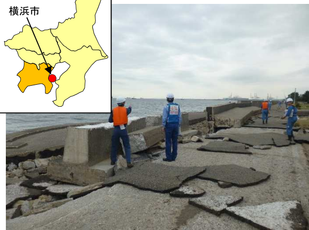
本牧D突堤 被災護岸調査状況