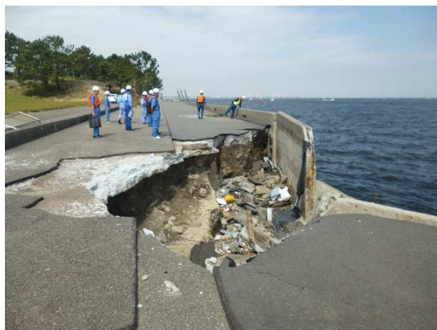
福浦 被災護岸調査状況