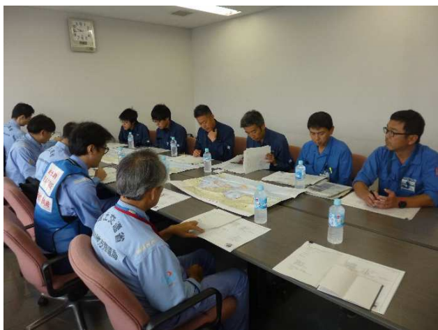
現地調査前の横浜市との打合せ状況

○横浜市から関東地方整備局に支援要請があり、9月14日(土)に、TEC-FORCE(緊急災害対策派遣隊)3名、国土技術政策総合研究所3名、港湾空港技術研究所4名の計10名が、本牧D突堤及び横浜市金沢区福浦の被災状況調査を実施。