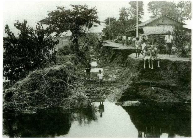
下都賀郡生井村下生井(現:小山市)の被害状況