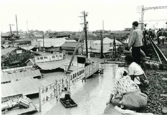
葛飾区の浸水状況