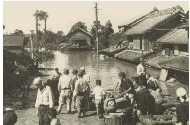
北葛飾郡栗橋町(現:久喜市)の浸水避難状況