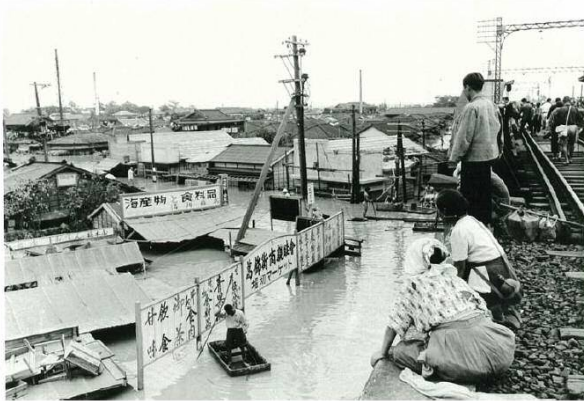
葛飾区の浸水状況