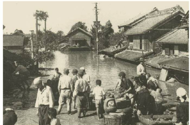
北葛飾郡栗橋町(現:久喜市)の浸水避難状況