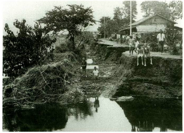
下都賀郡生井村下生井(現:小山市)の被害状況