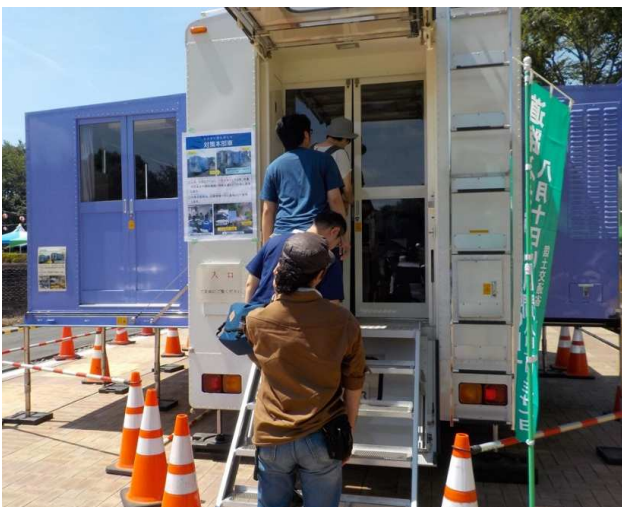
対策本部車の展示

「道の駅うつのみやろまんちっく村」において、令和元年8月8日（木）、宇都宮国道事務所、栃木県県土整備部、東日本高速道路(株)宇都宮管理事務所と合同で、緊急災害対策活動や道路のストック効果に関するパネルの展示、また、災害対策車(対策本部車)を展示し、広報活動を行いました。