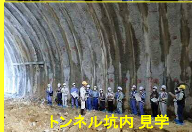
トンネル坑内 見学