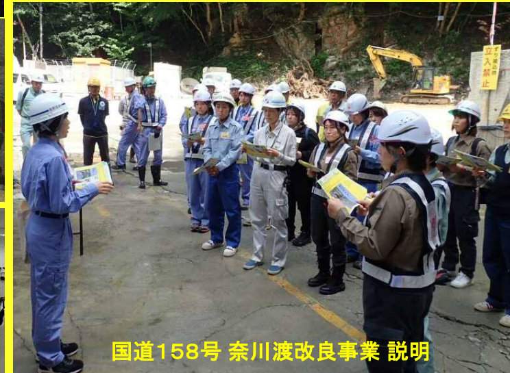
国道158号 奈川渡改良事業 説明