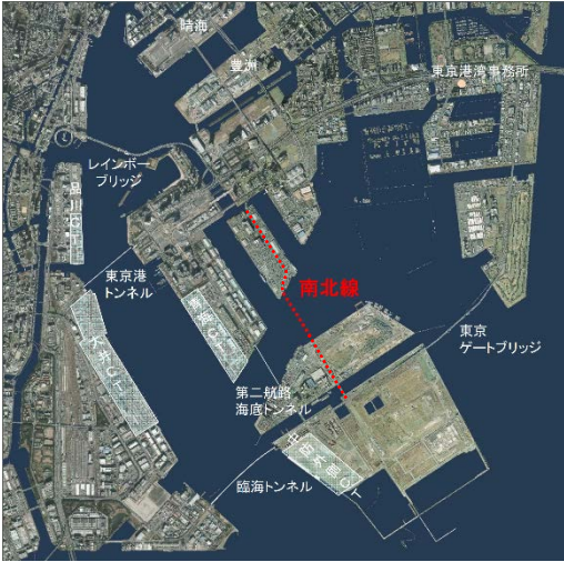
東京港臨港道路南北線の位置

なお、臨港道路南北線は、東京 2020 大会の際には関係者輸送ルートとしての活用も想定されています。