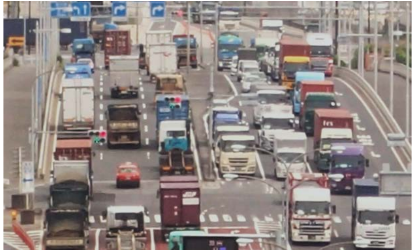
青海縦貫線の渋滞状況