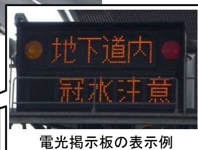
電光掲示板の表示例