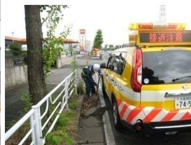
④パトロールの強化