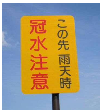
①標識(地下道手前の情報提供)