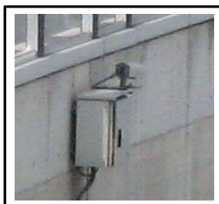
③監視装置 (カメラによる監視)