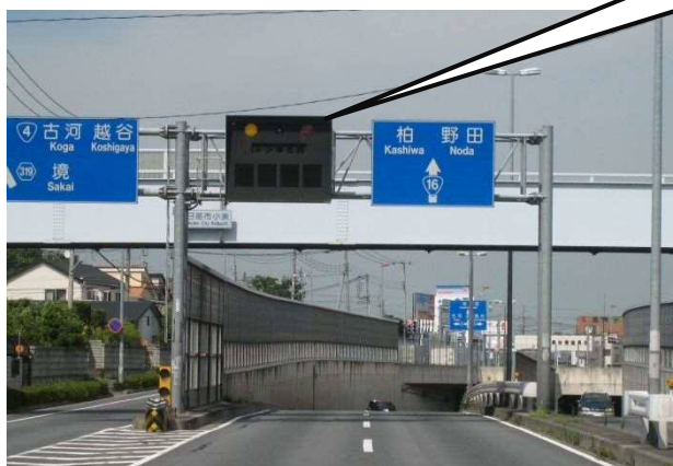
②電光掲示板(地下道手前の情報提供)