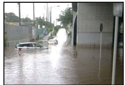
冠水状況（平成23年当時）国道298号川口市大字神戸地先

局地的な大雨によりアンダーパスの車道部など、周囲より低い箇所に雨水が急激に集中して排水処理能力を越えた場合には、一時的に道路が冠水する可能性があり、これにより安全な通行の確保に支障をきたす恐れがある箇所。