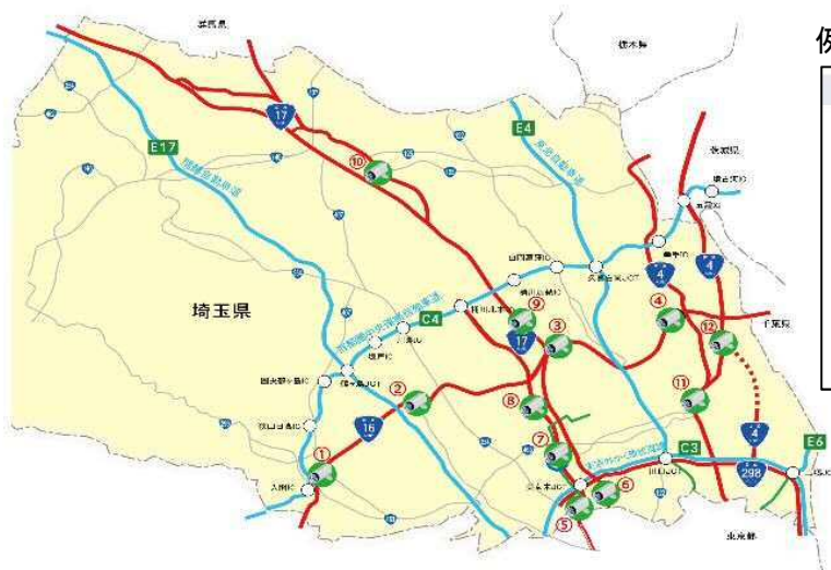
ライブカメラ設置箇所マップ