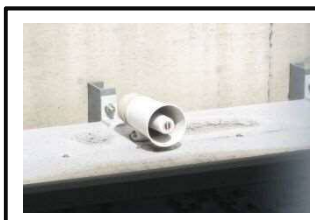
③警報装置 (音声による注意喚起)