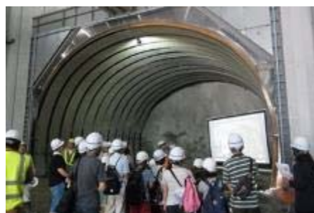
平成30年度見学会の様子 (上:建設機器乗車体験、下:トンネル見学)