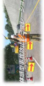
ドローンによる3次元管理実演