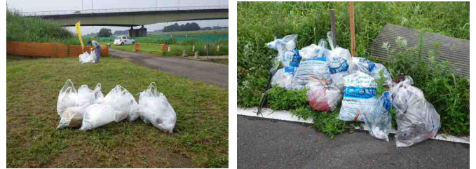
収集したゴミの一例

* H24・28年度は悪天候のため参加者減となりました。 * H26年度は台風8号の接近上陸予想により中止となりました。