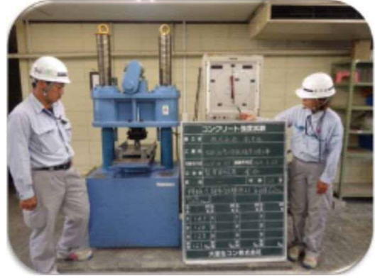
若手技術者育成(品質試験)