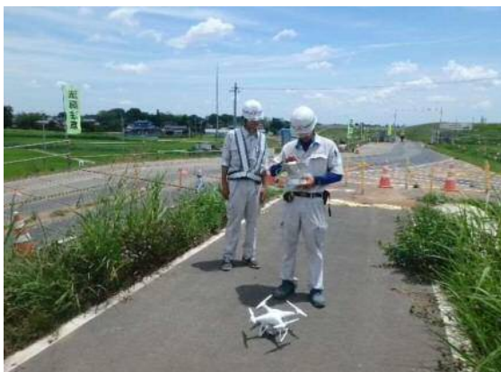
インターンシップ (ドローンの操作体験)