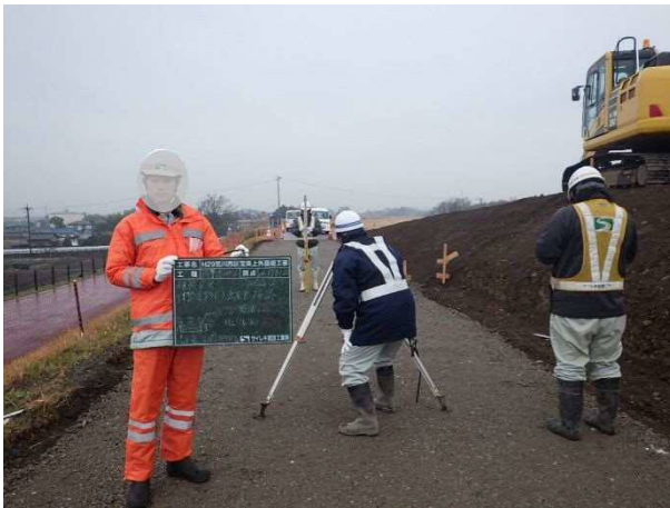
インターンシップ (測量体験)