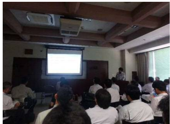
安全協議会発表 (若手技術者)