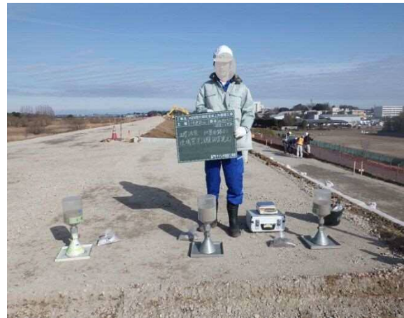
インターンシップ (路盤品質試験)