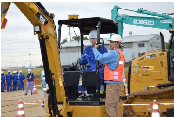
現場見学会 (ICT建機の操作体験)