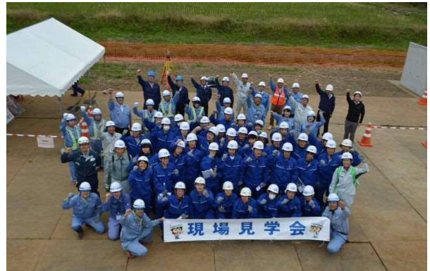
現場見学会 (高所作業車から集合写真)