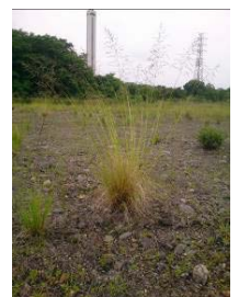
シナダレスズメガヤ