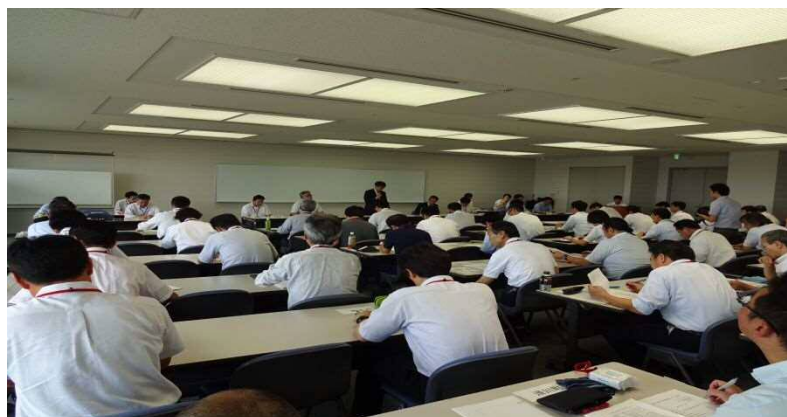
平成30年度第1回道路メンテナンス会議の実施状況（H30.8.21）