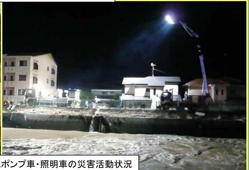
排水ポンプ車・照明車の災害活動状況