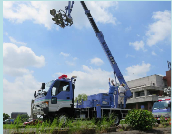
照明車の操作訓練