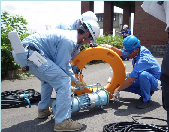
排水ポンプ 組立訓練