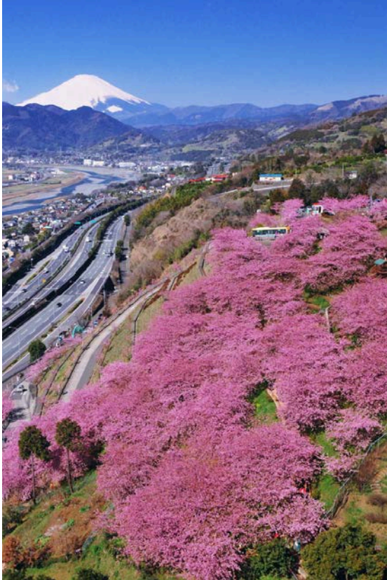
西平畑公園（ハーブ館ほか）からの富士