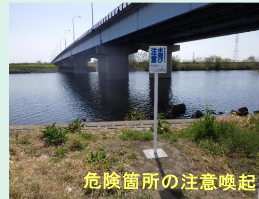
危険箇所の注意喚起

川には流れが急な所や深い所等の危険な場所があります。また、突然の大雨により急激に増水して危険な状態になることもあります。