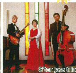
S'tan jazz trio