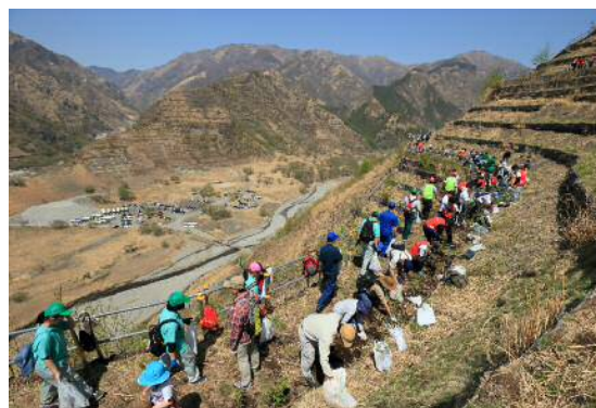
(春の植樹デー(平成30年実績：一般ボランティアの参加者2,000人、植樹7,000本))