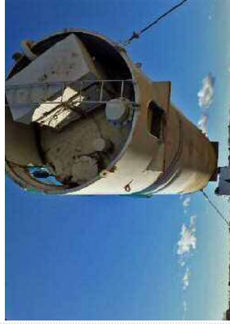
【富士山にぶつけるな！！】