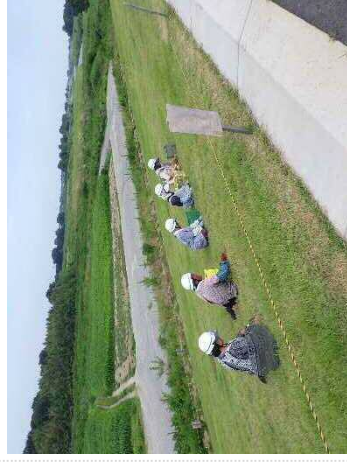
【ザ・プロフェッショナル】