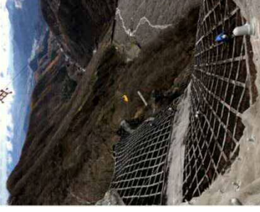
【世界遺産を未来に残すために・・・】