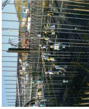
【大容量コンクリート打設中】