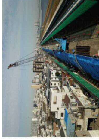
【ゼロメートル地域で堤防耐震化まっ盛り】