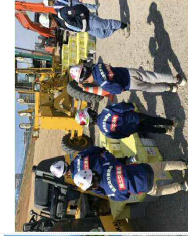
【未来の担い手は個性派ぞろい】