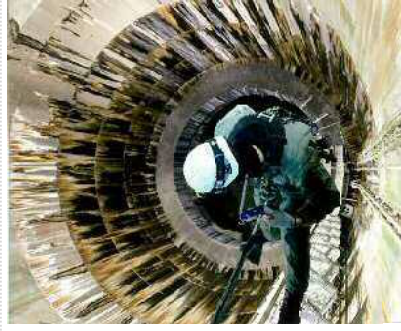
【特殊高所作業によるキャットウォーク点検作業】