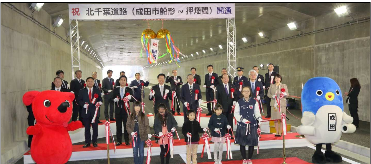
【開通セレモニー】はさみ入れ、くす玉開き