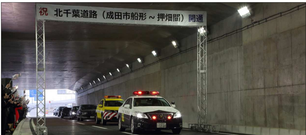
【開通セレモニー】通り初め