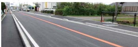
鋸南町下佐久間付近