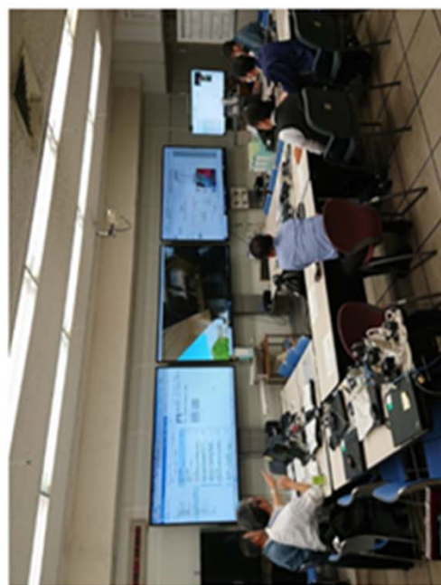
実施イメージ(モニタールーム)