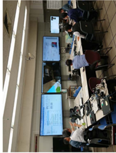
実施イメージ(モニタールーム)