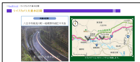
《ライブカメラ映像》