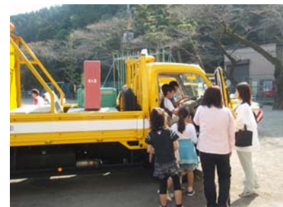
高速道路管理用車両展示