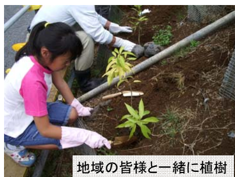
地域性苗木の生育例