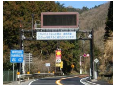
〔事前通行規制区間前後の雨量表示板・情報板〕