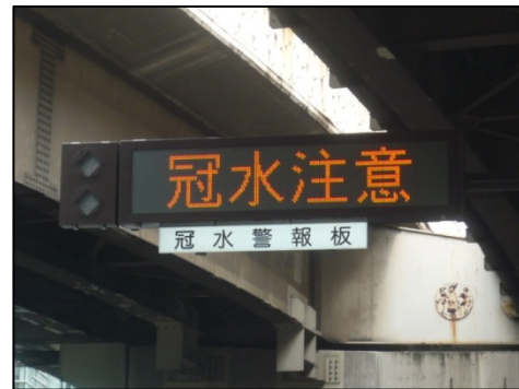
冠水情報を提供する電光標示板

冠水注意箇所とは、 通常の降雨では支障ありませんが 、短時間の異常豪雨で雨水が急激に集中し、ポンプなどの排水能力を超えた場合、一時的に水が溜まる可能性があり、交通に支障を来す恐れがある箇所をいいます。