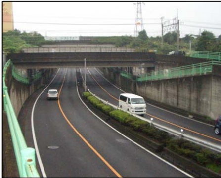
国道16号(八王子BP)中央線立体