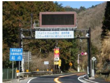
〔雨量による通行規制区間前後の雨量表示板・情報板〕