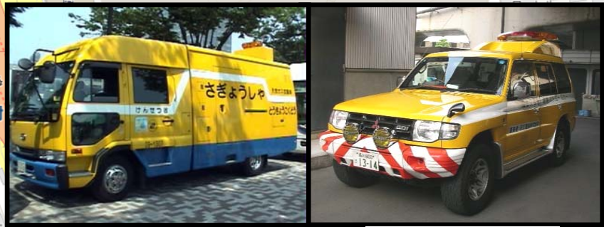
● (工事標識車) ● (国交省パトカー)