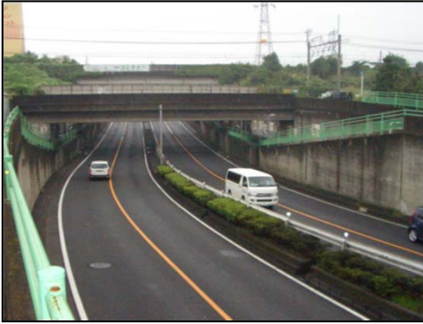
国道16号(八王子BP)中央線立体