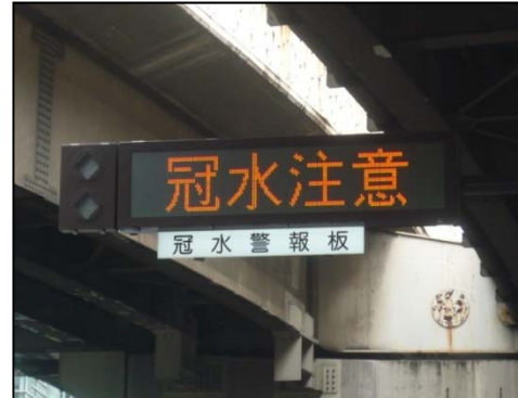
冠水情報を提供する電光標示板

冠水注意箇所とは、通常の降雨では支障ありませんが、短時間の異常な豪雨で雨水が急激に集中し、ポンプなどの排水能力を超えた場合一時的に水が溜まる可能性があり、交通に支障を来す恐れがある箇所をいいます。