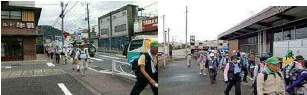
「甲州夢街道ウォーク」の実施状況(2012年相模湖にて)