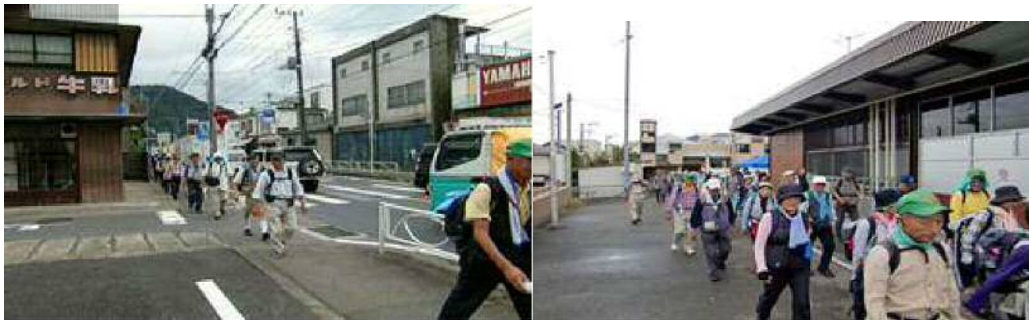
「甲州夢街道ウォーク」の実施状況

「甲州夢街道ウォーク」は、ウォーキングを通じて八王子・相模湖・藤野エリアの、甲州街道の歴史や自然にふれていただくことで、甲州街道の魅力を皆様に知っていただくことを目的とし、平成13年(2001年)より開催しているイベントです。これまでに約8,600名の方に御参加いただいております、今年で12回目を迎えることとなりました。