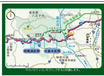
ライブカメラ映像