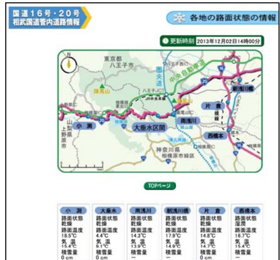
路面に関する道路情報