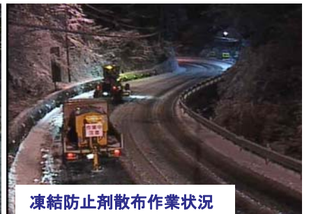
凍結防止剤散布作業状況